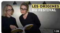
Pourquoi nous avons créé NOTRE FESTIVAL littéraire ?